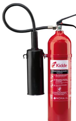
Modell: NOHA® KNK 5 art.nr 1821/488

Samtliga tillverkare, distributörer och serviceföretag som har koldioxidbrandsläckare från Kidde Sweden AB i sin underhållsprogram måste följa dessa anvisningar i syfte att säkerställa att brandsläckarna inte är defekta och att kundsäkerheten inte äventyras.