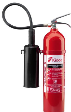
Modell: Tempus® KKS 5 art.nr 1821/486

Se illustrationerna av modellerna nedan.